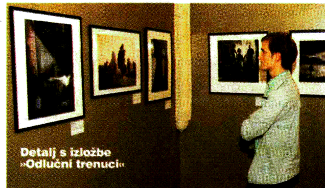
Detalj s izložbe »Odlučni trenuci«